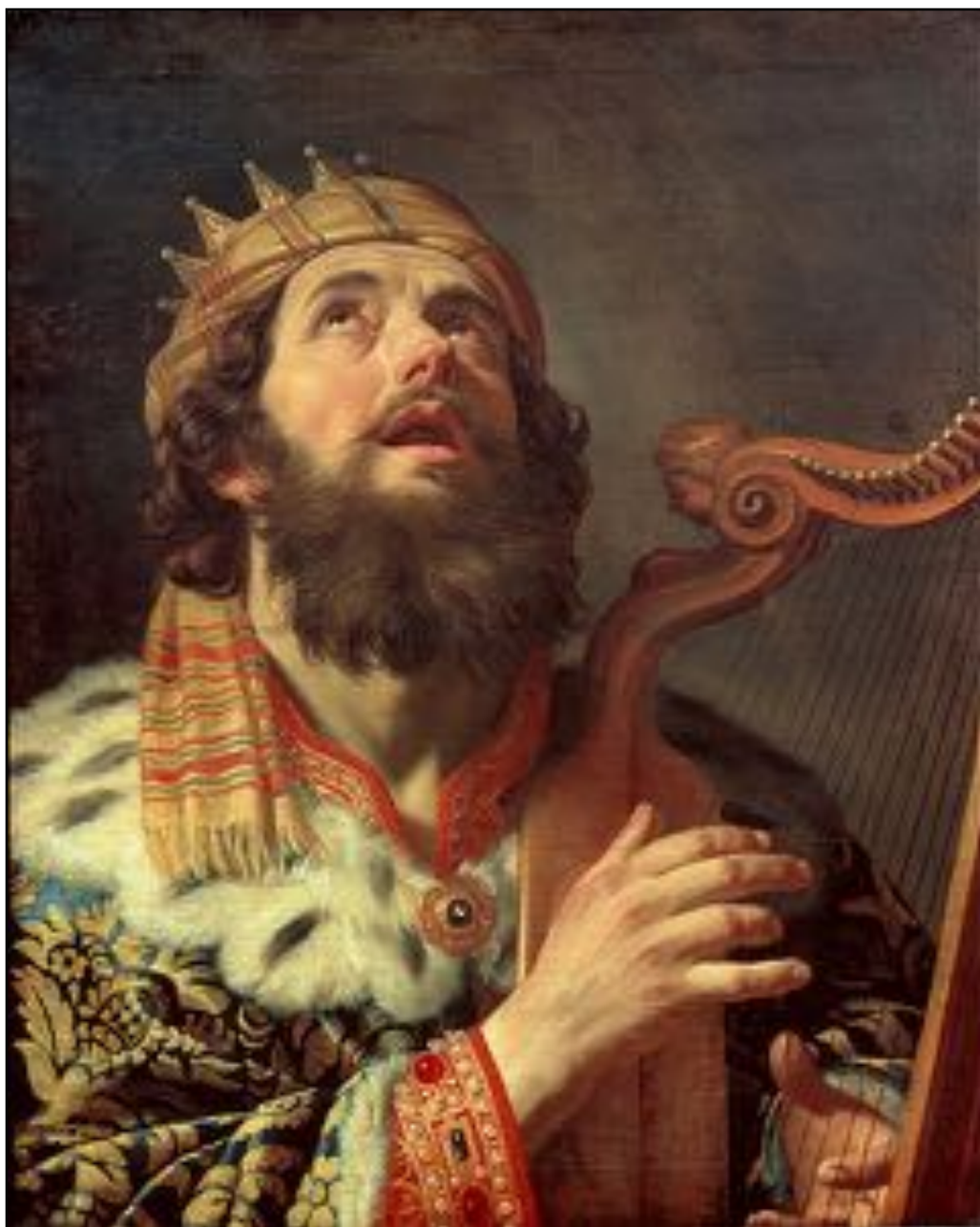
Kong David Playing the Harp Gerhard van Honthorst.

gapar och skakar på huvudet: Hänskjut din sak till Herren. Han måtte befria och rädda honom. Han har ju sitt behag till honom. [...] De delade min klädnad mellan sig och kastade lott om min livklädnad» (v. 7 och v. 19).