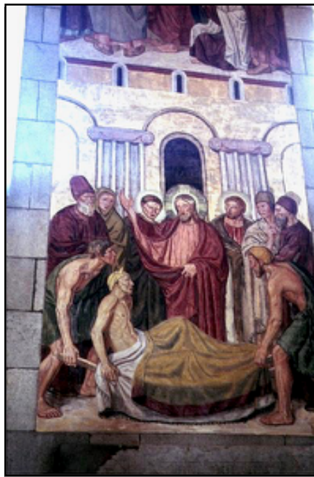
Fra Viborg Domkirke: Jesus helbreder en lam mand Joakim Skovgaard.

Den spesielle diakoni knyttes til kirkens embete hvor Kristus var den første diakon. Mark 10:45. «Menneskesønnen kommer for selv å tjene». Jesus sendte ut sine apostler. Matt 10:1. De skulle tale og tjene. Forkynnelse og diakoni var to sider av samme sak. Ap.gj 4:33-35. Etterhvert ble det så mange oppgaver at de valgte ut noen til å ivareta apostlenes diakonitjeneste. Ap.gj 6.