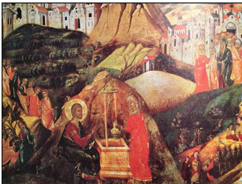
Jesus og kvinnan vid Jakobsbrunnen. Ikon fra 1600.t. i Canellopoulosamlingen i Aten.

aning om vem han är som talar med henne. Det visar sig i hennes tilltal, först «du som är jude», och här är det ännu fråga om vanligt vatten för kroppens törst. När Jesus sedan för in samtalet på vem han är och det Livets vatten för själens törst som han har att ge, då, i de följande replikerna, tilltalar hon honom «Herre». Så kommer då denna kalldusch: «Gå och hämta din man!» Hennes svar kan låta lite tvärt och avböjande, och kanske var det så. Men efter Jesu avslöjande ord om hennes fem män och hennes nuvarande icke-man synes hon ha blivit ytterligare stärkt i tron på vem den mannen är som hon talar med. «Herre, jag ser att du är en profet.» Inga försök