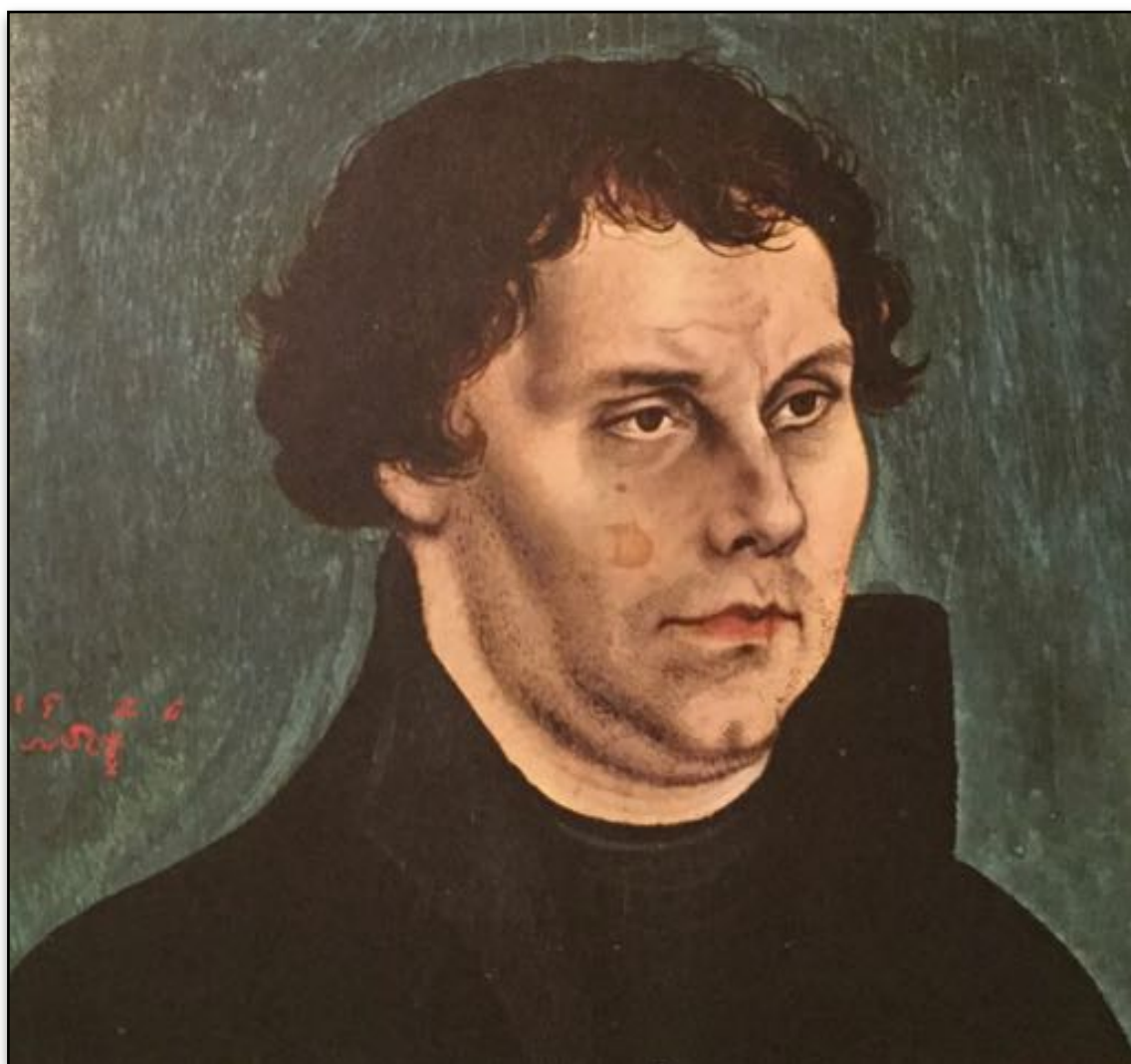
Martin Luther malt av Lukas Granach d.s.