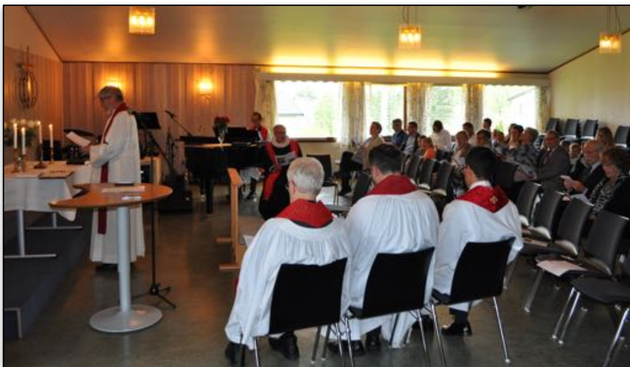
Fra gudstjenesten i Spydeberg.