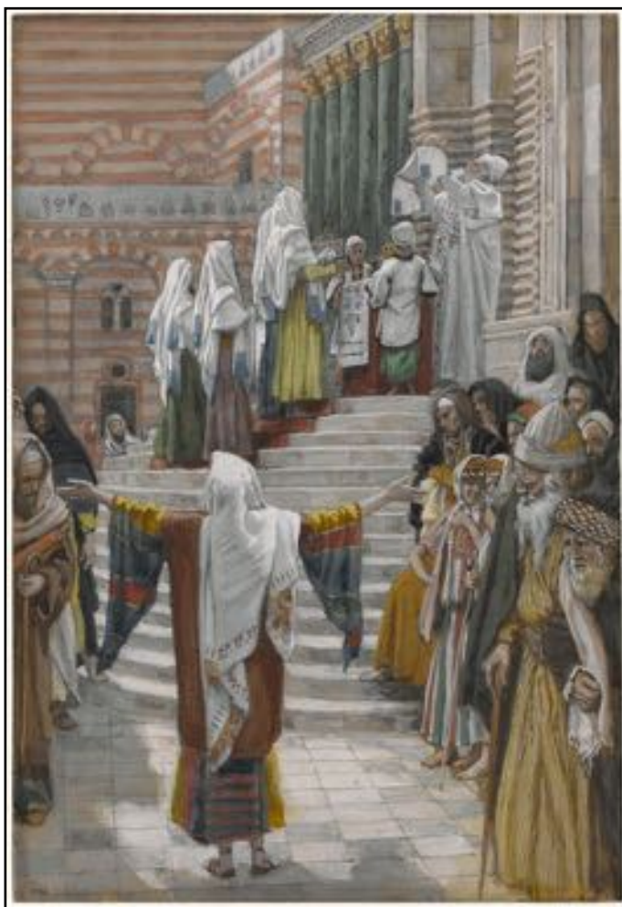
James Tissot, The Presentation of Jesus in the Temple Brooklyn Museum

Lovad vare Herren, Israels Gud, som har besökt sitt folk och återlöst dem. Han har upprättat åt oss ett frälsningens horn i sin tjänare Davids hus, så som han för länge sedan lovat genom sina heliga profeter (Luk 1:68-70).