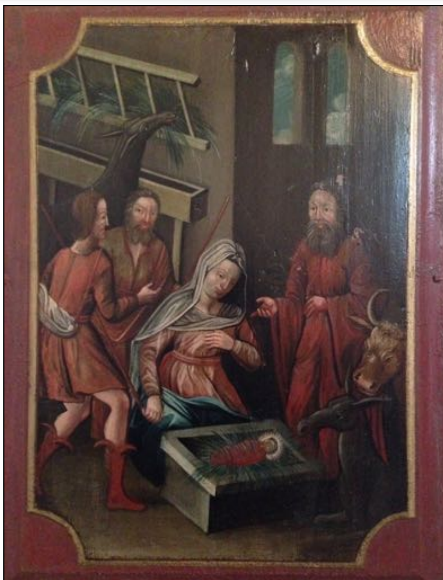
Fra Kristiansand domkirke