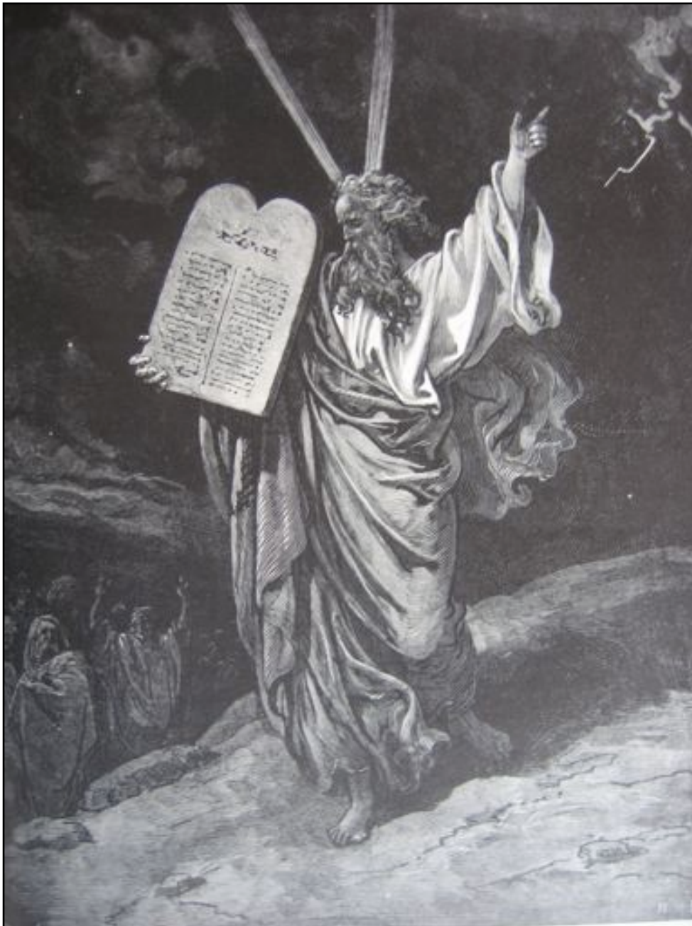
(Moses og lovens stentavler - Fra Dores bildebibel.)