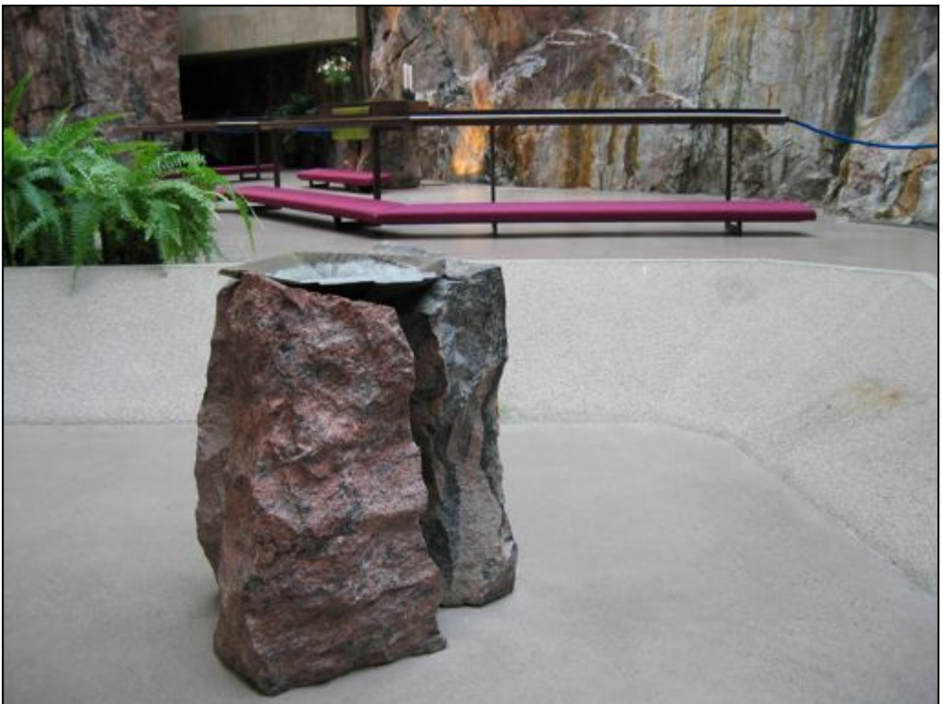
"Døpefont i Bergkyrkan i Helsinki "

Kyrkblad – Evangelisk – lutherska bekännelsekyrkan Kirkeblad – Den Evangelisk lutherske bekjennelseskirke Nr 2. 2011 årgang.15