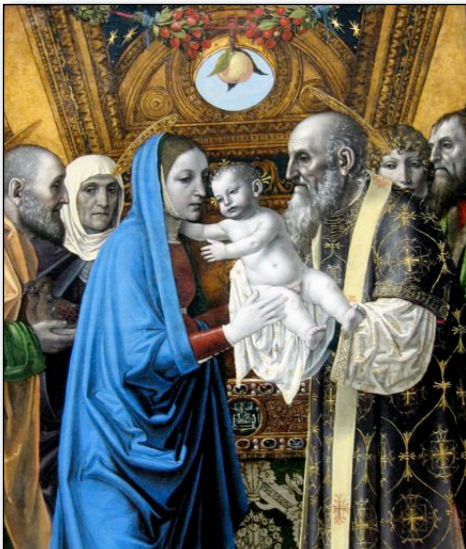
”Jesus hos Simeon i Templet”- Louvre I Paris

Han har inför sina ögon i tro fått skåda inte bara ett salighetens hopp för egen del utan han har fått skåda Guds