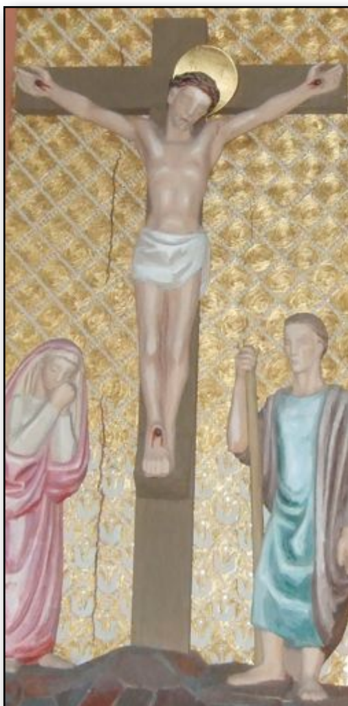
Fra Nes kirke

I psalmen säger han: ”att göra din vilja, min gud, är min glädje”. Och i Getsemane ber han: ”ske inte min vilja utan din”. Ja, ”Herrens vilja ska ha framgång genom honom.”