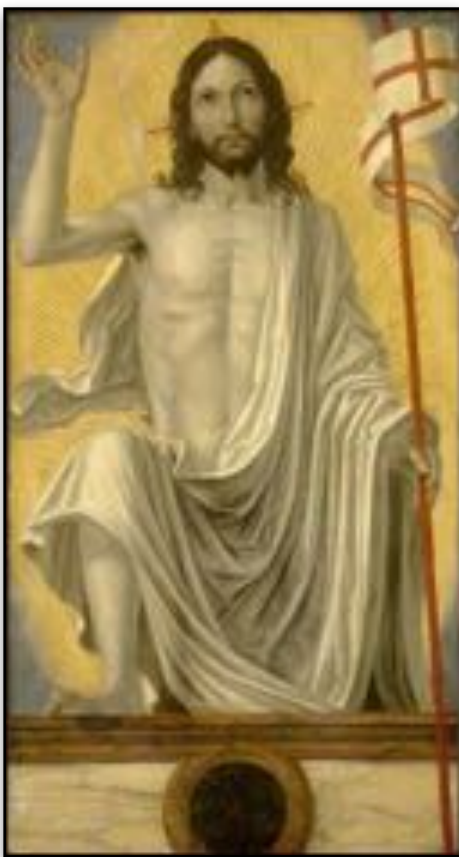
Ambrogio di Stefano Bergognone (ca. 1460-1523) Christ Risen from the Tomb (c. 1490), National Gallery of Art, Washington, DC

Så verkar vi vara tillbaka på ruta ett. Kanske måste vi till slut ändå godta lärjungarnas version. Den ger en naturlig och okonstlad beskrivning av skeendet och den saknar de blindskär som andra teorier strandar på. Men så var det då detta med att en död människa får liv igen? Ja, där står vi. Det finns till sist bara två möjligheter: det som hände i samband med Jesu död, begravning och uppståndelse har antingen en naturlig förklaring eller en övernaturlig. Om vi nu avvisar lärjungarnas version, så sker det därför att den innefattar ett övernaturligt skeende, inte p.g.a. brister i framställningen. Det sker utifrån en livsåskådningsmässigt betingad förutfattad mening. Nu undrar någon kanske: Kan vi då