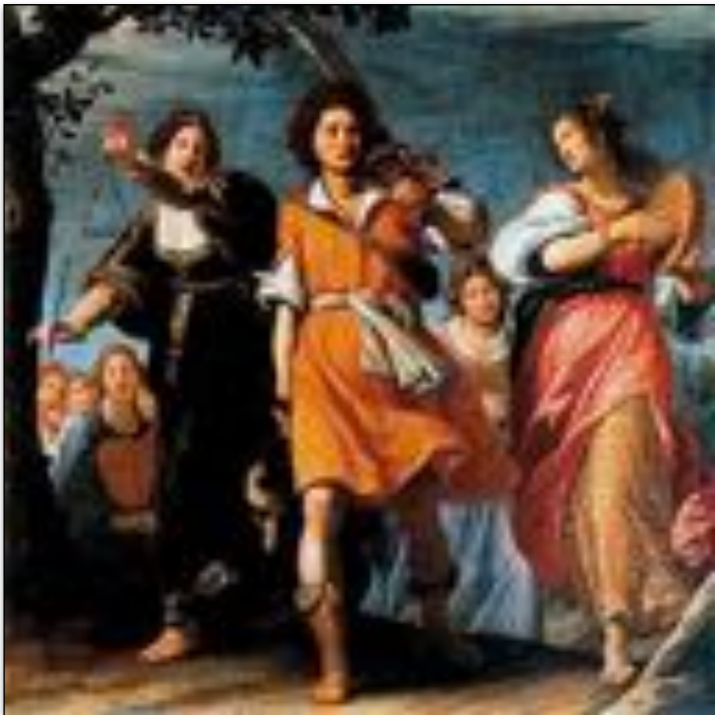
«Den triumferande David», maleri av Matteo Rosselli, 1620

du ödmjuka dig inför Herren och bekänna din synd. Om kung David, drottningen av Saba, drottning Viktoria och många andra kungar inte varit för fina och förnäma för att komma som syndare till Guds tron, må inte du i högmod vara för stolt och egenrättfärdig så att du stänger dig själv ute från Guds rike. Herren ser till den ringe (Ps. 138:6), ja ringa män har han upphöjt (Luk. 1:52). Kom därför till Jesus och be