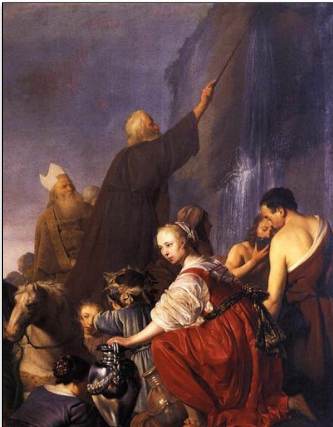
I tro slo Moses på klippen / Moses striking the rock -Pieter de Grebber 1630

spott” (50:6). Därpå målas tjänarens lidande för våra ögon: