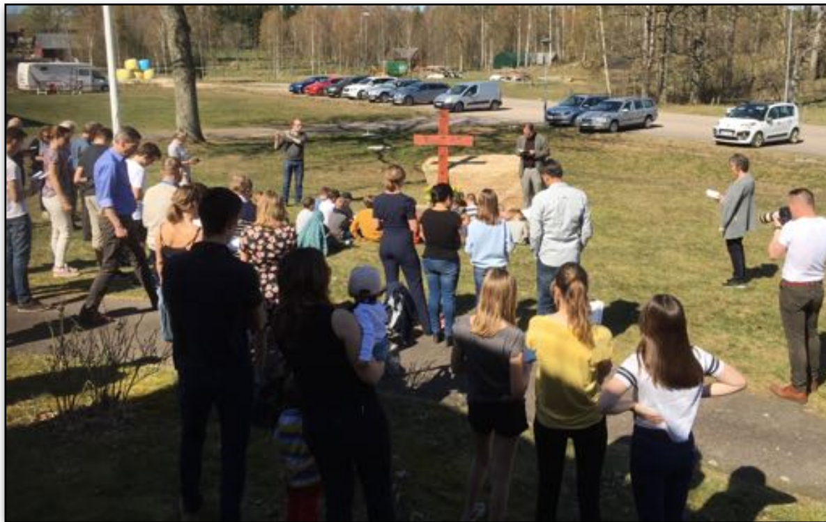
Påskeleir på Sunnerbogården 2019