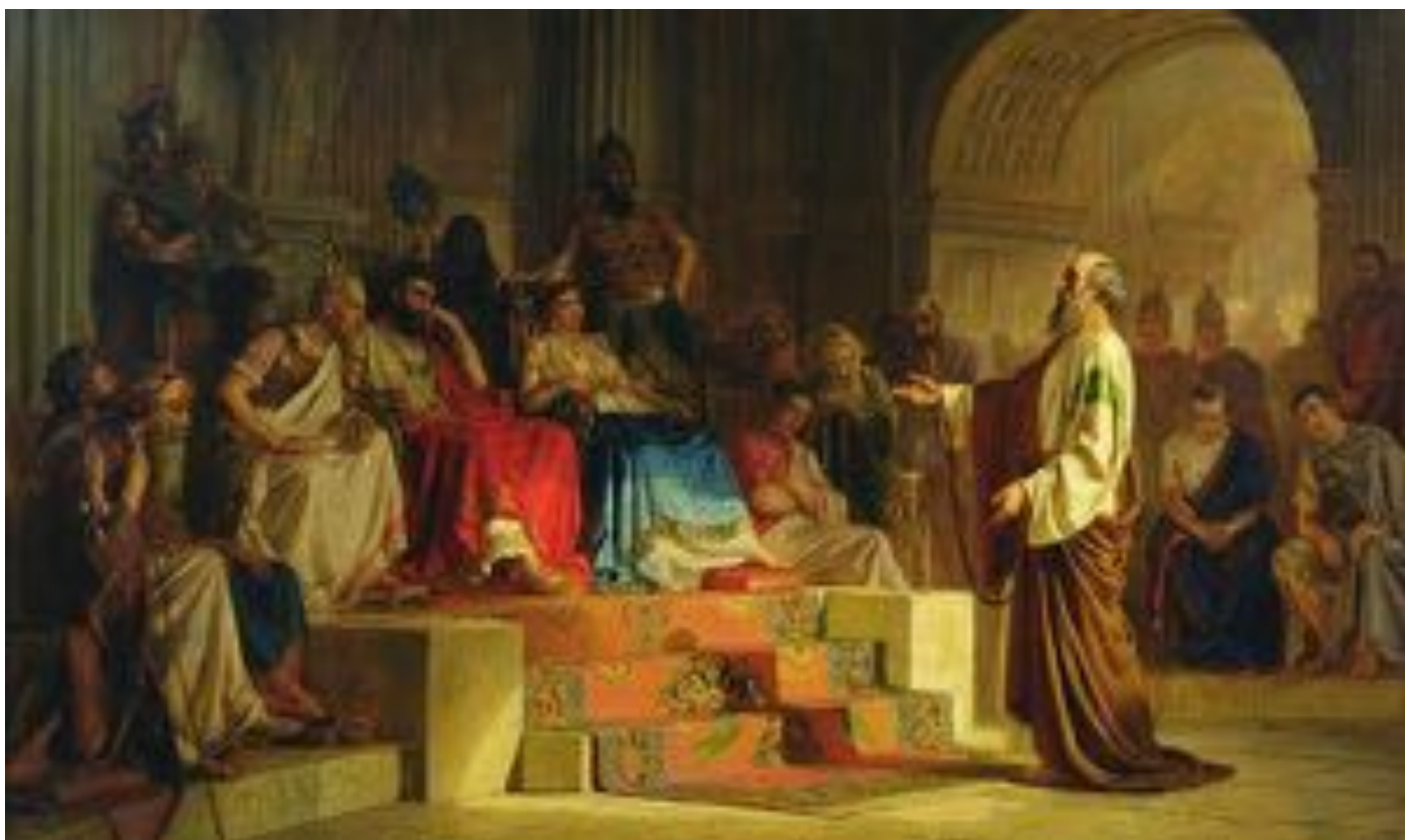
Apostelen Paulus' rettssak, av Nikolai Bodarevsky, 1875. Agrippa och hans søster Berenice sitter begge på tronen.

Det som på något sätt förenar dessa olika tänkesätt är att människan vill