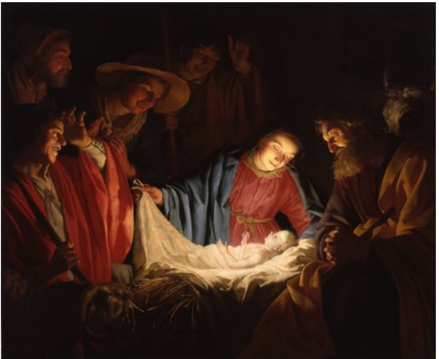
Gerard van Honthorst -Adoration of the Shepherds (1622)