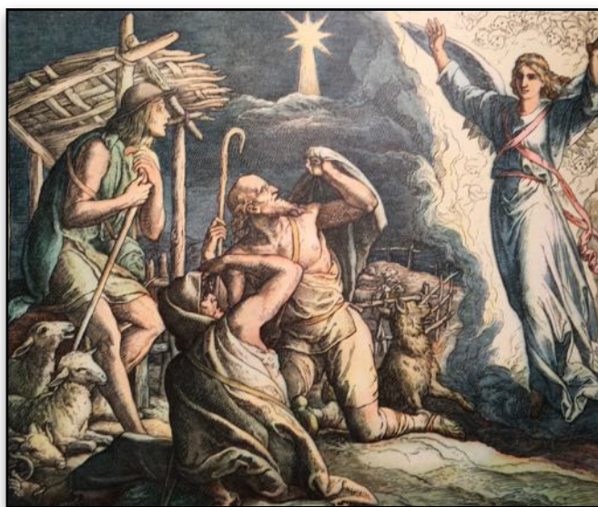
Fra Barnas bildebibel- Schnorr von Carolsfeld

hendelsen med Guds eget ord. Frelseren, Messias, var lovet gjennom hele GT. Han skulle fødes i Davids ætt, og det slås fast at denne frelseren, denne Messias, er Gud selv.