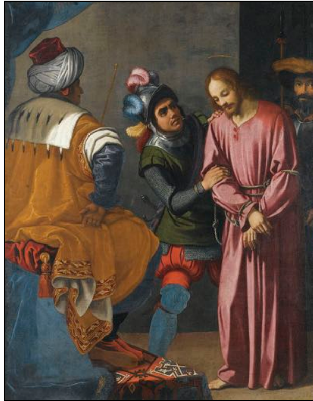
Agostino Ciampelli, Ecce Homo, 17th century

Nu säger vi kanske att de där gamla sederna tillämpar vi inte i längre i vår tid. Nja, förvisso tillämpar vi inte dessa fasteregler i våra församlingar, men det (hoppas jag) hänger inte samman med att vi härvid skulle ha likriktats efter denna världens tänkesätt. Lite djupare än så bör väl vi gå. Vid reformationen övertog man inte, förde man inte vidare dessa medeltida fasteseder. Vi kan nog skönja två skäl. Dels deras karaktär av lagiska påbud, dels att de blott alltför lätt kom att uppfattas som en förtjänstfull gärning som bidrar till att förvärva Guds nåd och välbehag. Något kategoriskt avvisande av fastan som sådan har man dock inte;