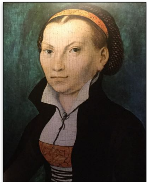
Martin Luther og Katharina von Bora giftet seg i 1525. Her er de portrettert av Lucas Cranach d.e.

middelalderen. Foreldrenes autoritet var fornektet og ble undergravet av kirken. Regler og forskrifter som ikke finnes i skriften veide tungt på mann og kvinne i ekteskapet. Kort sagt: ekteskapet som institusjon, foreldrenes autoritet, familien, og den enkeltes samvittighet ble overlatt til den verst tenkelige