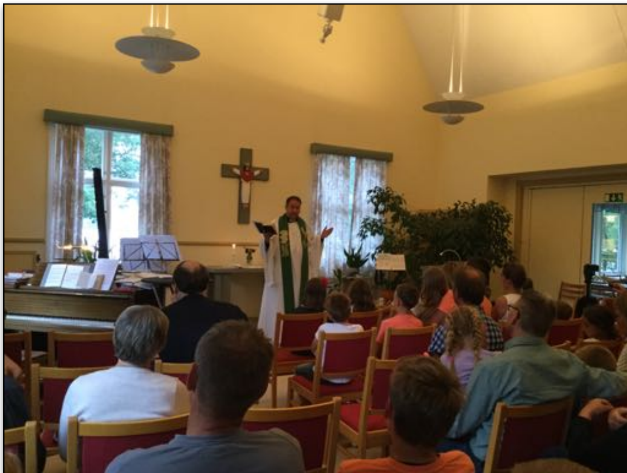
Barnebibeltime på årskonferansen 2017.

Den första döden , eller döden helt enkelt, är den fysiska döden. Den måste alla genomlida