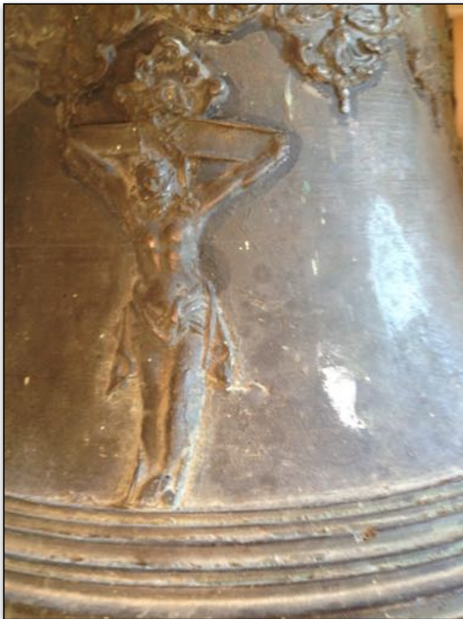
Bibelbudskap på gammel kirkeklokke i Enebakk kirke foto GAHj.

Bibelns profeter – de sanna profeterna – intar en mellanställning mellan prästerskap och