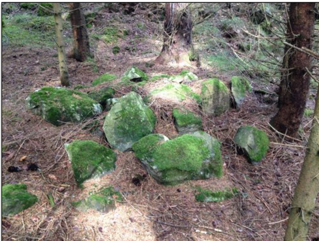
Gammel steinrøys på Knapstad

gamla förbundet. Vi skall därför självfallet inte utföra avrättningar av dem som bryter mot Guds bud. Däremot skall vi, såsom Jesus instruerar i Matt. 18:15–18, försöka föra den som syndat tillrätta. Men om detta inte går, skall vi, fortfarande enligt Jesu instruktion, använda nya förbundets motsvarighet till det gammaltestamentliga dödsstraffet: ”Då skall han för dig vara såsom en hedning och publikan” (Matt. 18:17), d.v.s. vederbörande skall drabbas av det som kallas exkommunikation, bannlysning, utslutning ur församlingen.