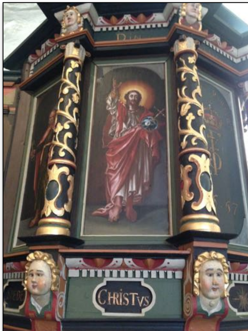
Prekestol i Enebakk kirke