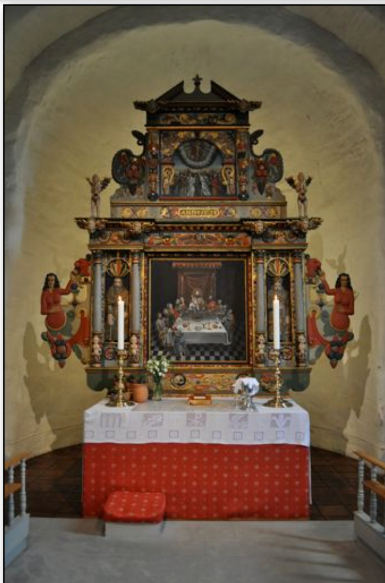
Altartavle i Råde kirke i Østfold.

Kyrkblad – Evangelisk – lutherska bekännelsekyrkan Kirkeblad – Den Evangelisk lutherske bekjennelseskirke Nr 3. 2012 årgang.16