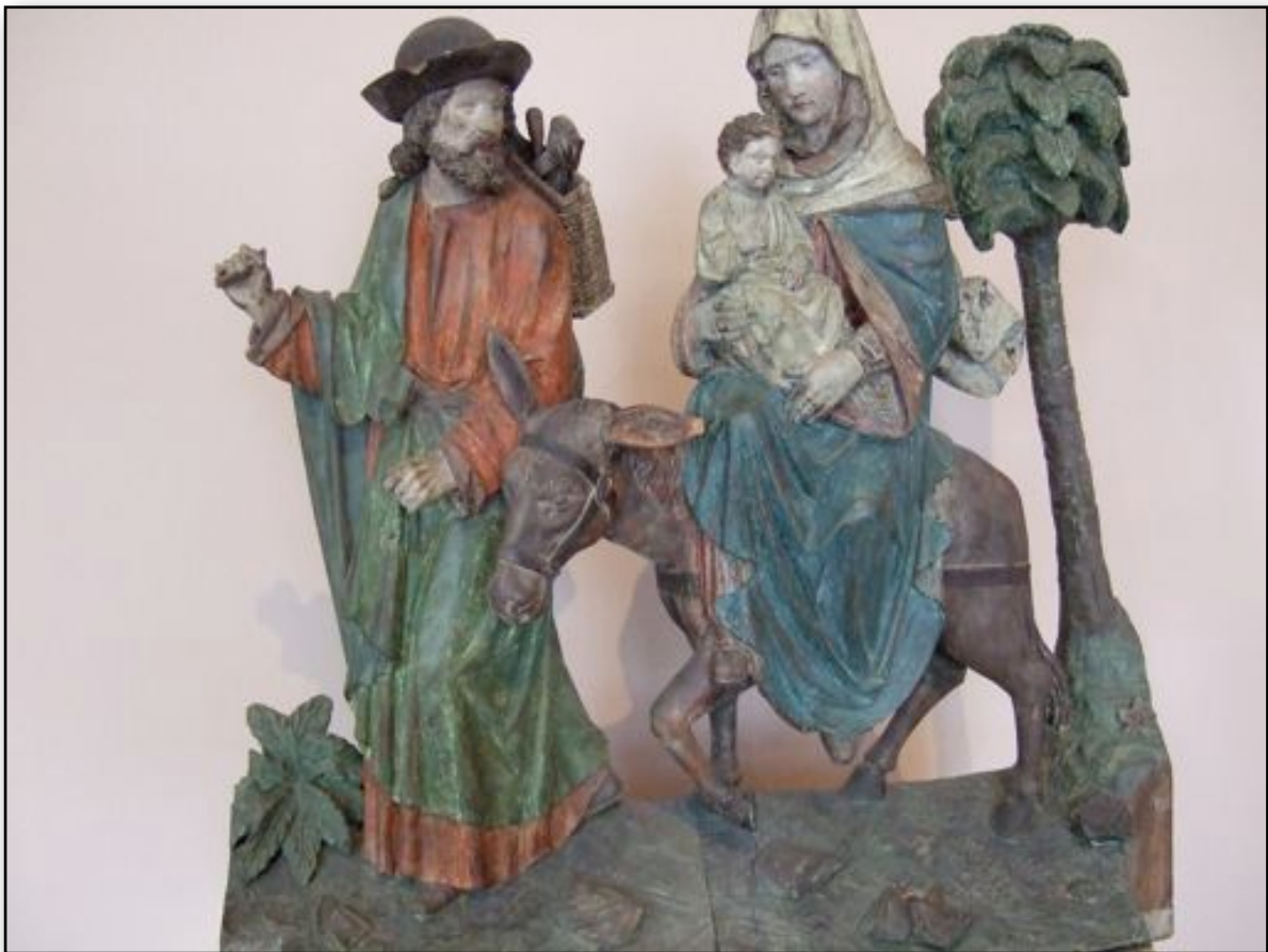
Altertavle i Råde kirke i Østfold.

Kyrkoblاد – Evangelisk – lutherska bekännelsekyrkan Kirkeblad – Den Evangelisk lutherske bekjennelseskirke Nr 4. 2012 årgang.16