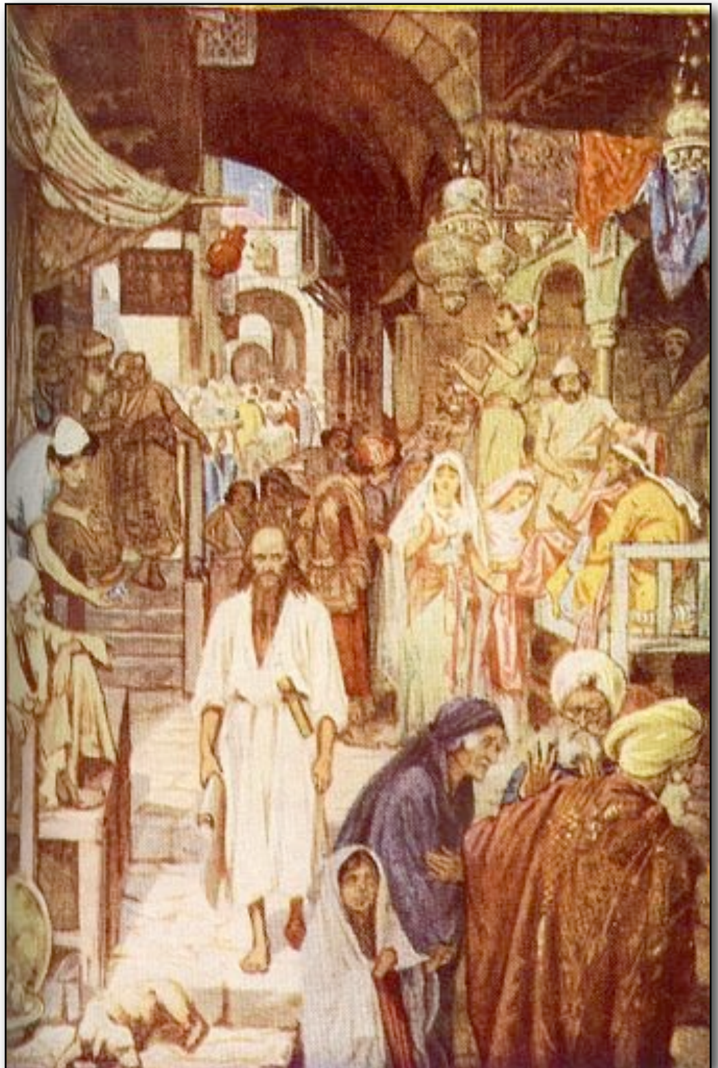
Profeten Jesaia i Jerusalem. - Fra Barnebibelen 1967 J.W. Cappelens forlag