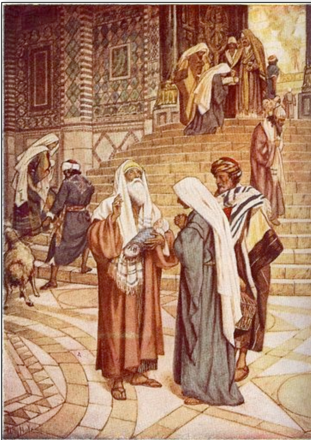
Gamle Simeon möter Jesus. - Fra Barnebibelen 1967 J.W. Cappelens forlag